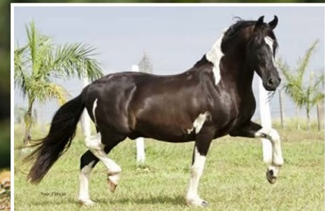
SEU AVÔ SINCERO DO PORTO AZUL