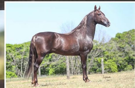
SEU PAI GHANDI CAPIM FINO