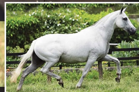
SUA AVÔ ARGÔNIA ITAMBI DA STELLAMARIS