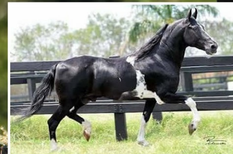
SEU AVÔ ALEGRE DA TODAY