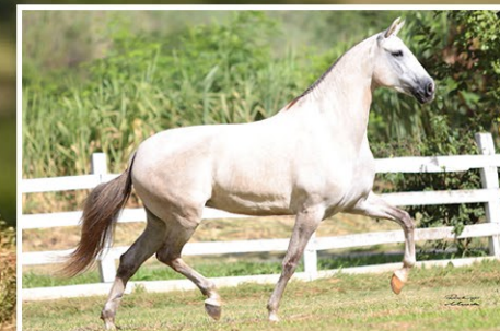
SUA IRMÃ AUDÁCIA DE TRÊS CORAÇÕES