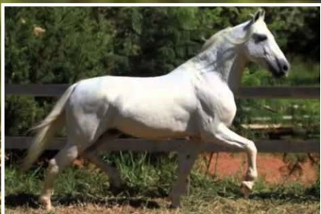
SEU AVÔ HÚNGARO DA VISÃO