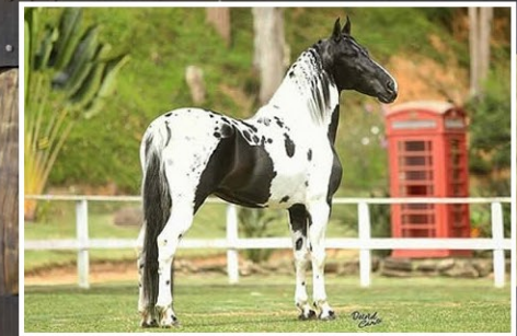
SEU PAI FALANTE DO MALBORO