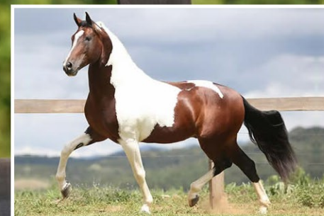
SEU PAI EQUIPADO DO RANCHO PAMPA