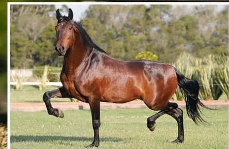
SEU AVÔ RINGO DO CÍRCULO D