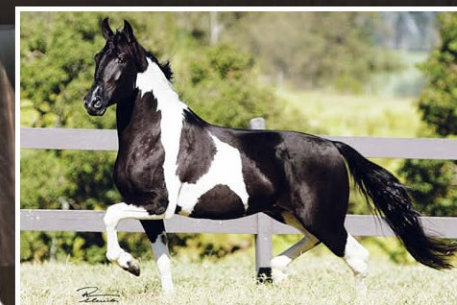
SEU PAI RAYBAM DA SANTA ESMERALDA