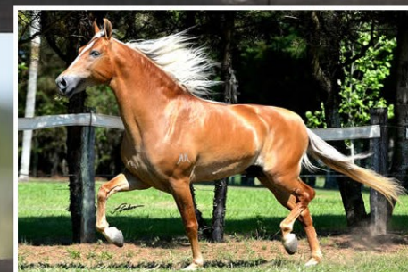
SEU PAI TRIUNFO MEAÍPE