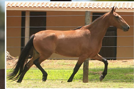
SUA FILHA CHANEL FSAP