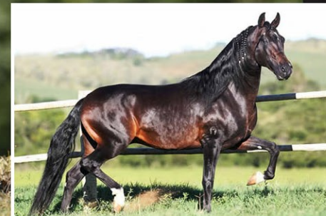
SEU AVÔ ARGOS DAS MINAS GERAIS