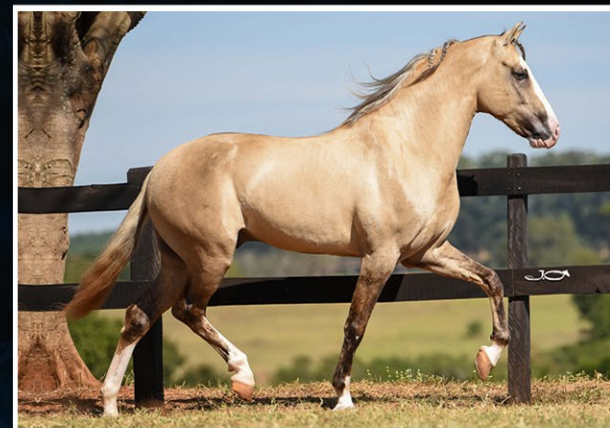
APOLO DA AGROTEXAS

São eles: Apolo da Agrotexas, cavalo Campeoníssimo em pistas, filho do extraordinário reprodutor Fator da Cavarú-Retã, tido, por muitos como a expressão maior da raça. Tarú Elfar, filho da lenda do Mangalarga Marchador Favacho Estanho. E Apolo FSAP, macho de extrema beleza, filho de Ícaro do Portal, neto do Fator da Cavarú-Retã.