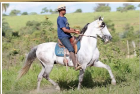
SEU PAI UNO HEBRAICO