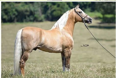
SEU PAI FATOR DA CAVARÚ-RETÃ