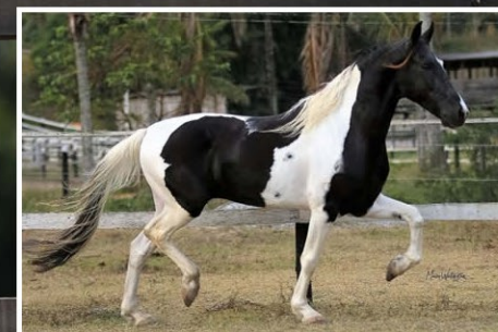
SEU PAI REBENTO DA TODAY