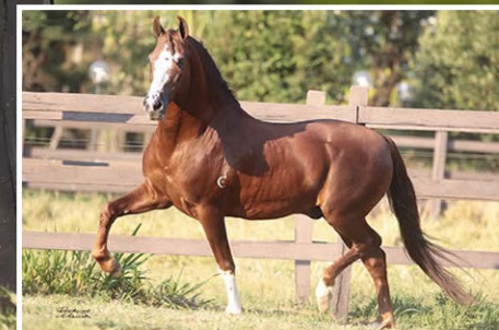
SEU AVÔ GALANTE DO EXPOENTE