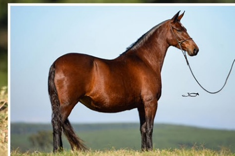
SUA MÃE ALEGRIA JB