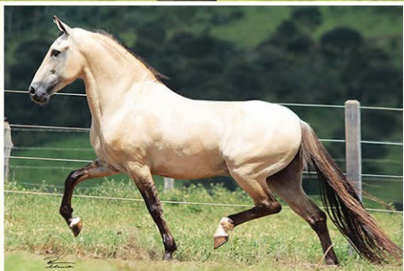
SEU AVÔ FAVACHO ESTANHO