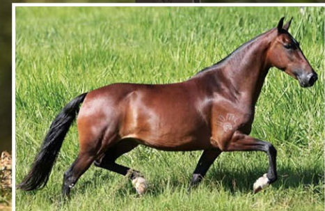
SUA AVÓ ATLANTA DO XANGAI