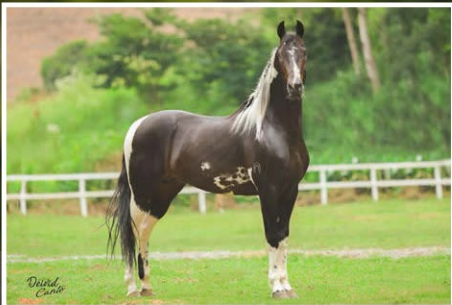
SEU PAI ZAMBÉ DA SANTA ESMERALDA