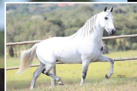
SEU PAI QUEBRANTO BELA CRUZ