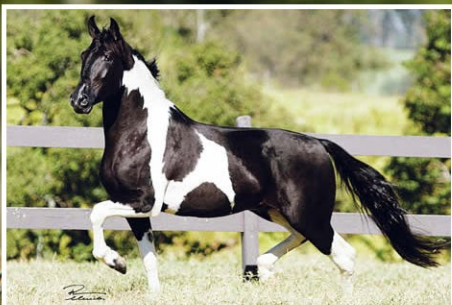
SEU AVÔ RAYBAM DA SANTA ESMERALDA