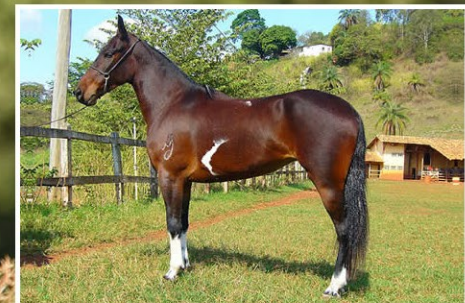
SUA MÃE KEROZENE JOCAMAN