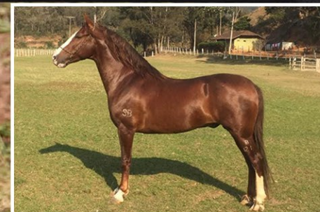
PRENHEZ POR BALAIÓ SERRA BELA