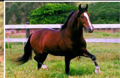
SEU AVÔ FAVACHO ÚNICO