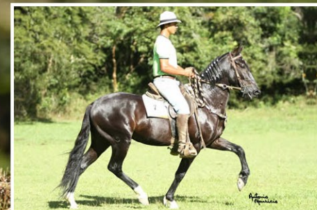
SEU AVÔ CARVÃO CAXAMBUENSE