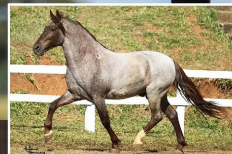
SEU PAI TOPADA SAFARI