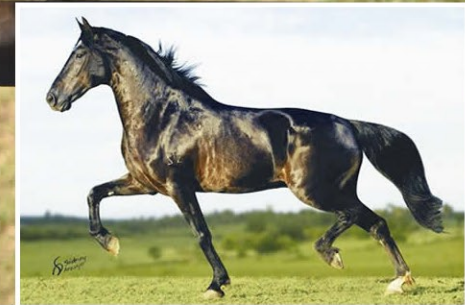
SEU AVÔ ELFO DO PORTO AZUL