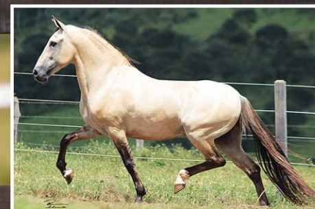
SEU PAI FAVACHO ESTANHO