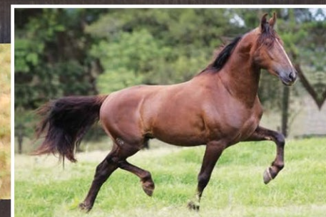
SEU PAI JAGUNÇO DO REBANHO