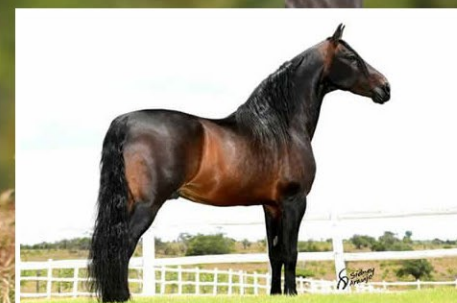
SEU AVÔ GAVIÃO DAS CARAÍBAS