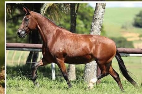
SUA MÃE VAMP JB DA OGAR