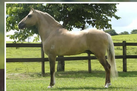
SEU PAI ÍCARO DO PORTAL