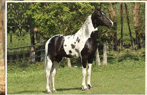
PRENHEZ POR HOLOFOTE REI DOS REIS