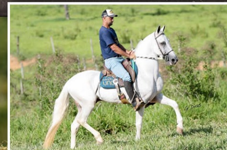
SEU PAI UNO ADÔNIS