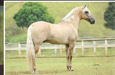
SEU PAI NIQUEL DA ARCA DE NOÉ