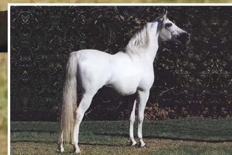
SEU AVÔ LAGLÓRIA ESSEN