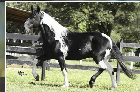
SEU PAI DESAFIO DE NANUQUE