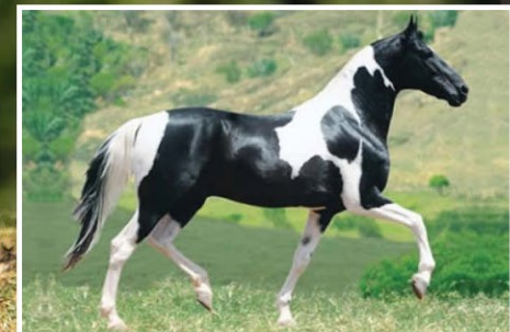
SEU AVÔ IMPERADOR JP