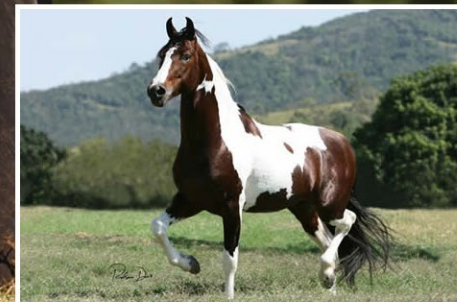
SEU AVÔ ELO KAFÉ DA NOVA