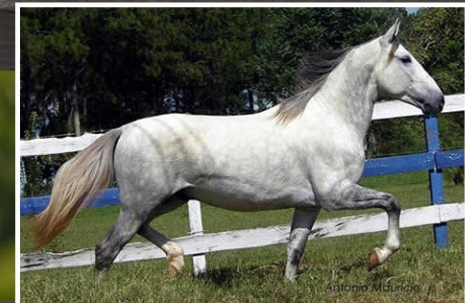
SEU PAI TOPADA UNIVERSO