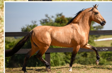
PRENHEZ POR TARÚ ELFAR