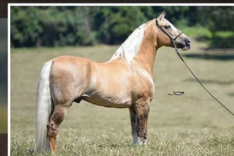
SEU PAI FATOR DA CAVARÚ-RETÃ