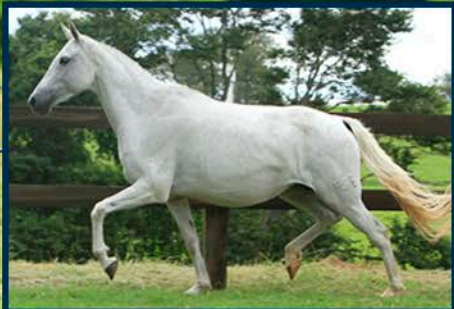
SUA MÃE: MAREZIA DE MARIPÁ