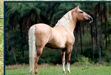
SEU AVÔ: FATOR DA CAVARÚ-RETÃ