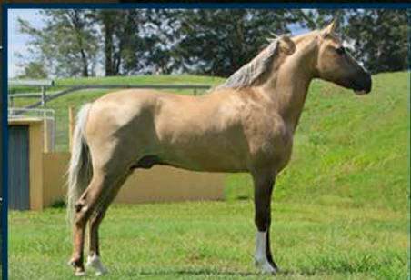
SEU PAI: ÍCARO DO PORTAL