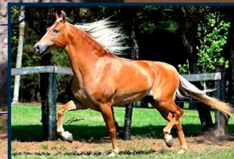
SEU PAI: TRIUNFO MEAÍPE