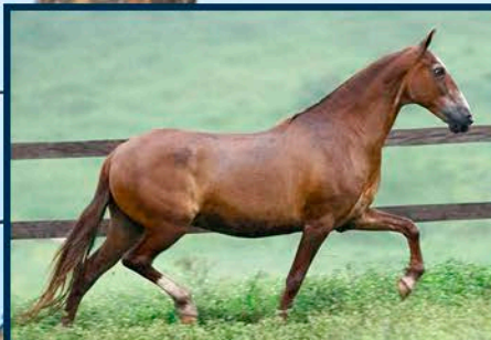
SUA AVÓ: CEREJA DO CÍRCULO D