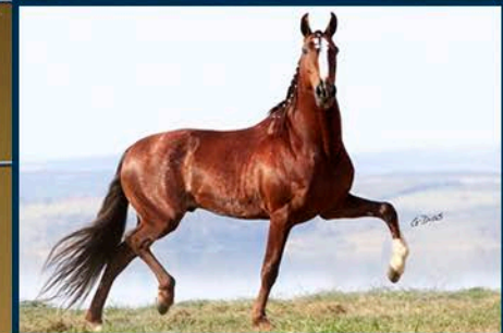
SEU PAI: XIMANGO DO CÍRCULO D