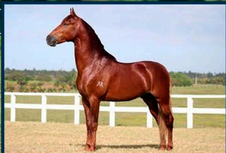
SEU AVÔ: MEAÍPE MEAÍPE