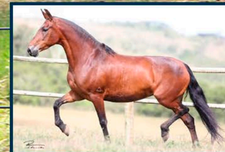
SUA MÃE: ESGRIMA DAS MINAS GERAIS