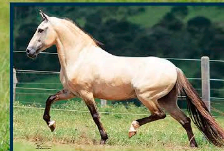
SEU AVÔ: FAVACHO ESTANHO