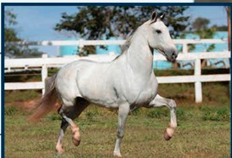
SEU PAI: SALMON N.R.M.