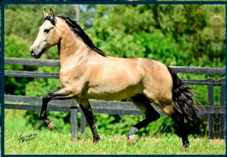
SEU PAI: ZAHIR DE MARIPÁ