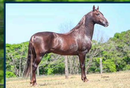
SEU PAI: GHANDI CAPIM FINO