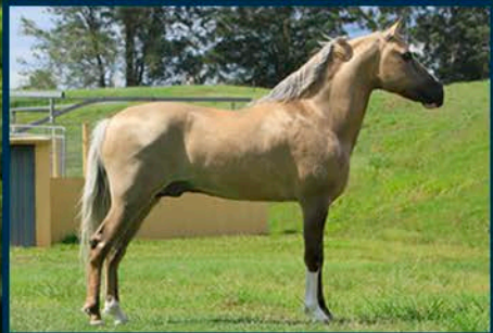
SEU PAI: ÍCARO DO PORTAL