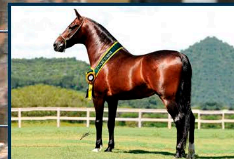
SEU AVÔ: JIPE DA MANDASSAIA