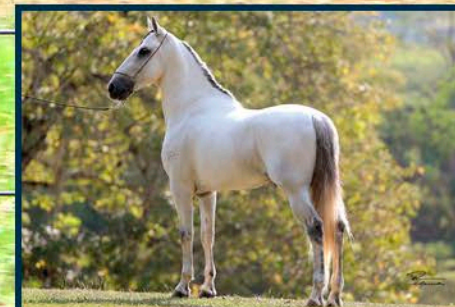
SEU AVÔ: FUZIL RRC