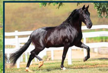
SEU AVÔ: CARVÃO CAXAMBUENSE