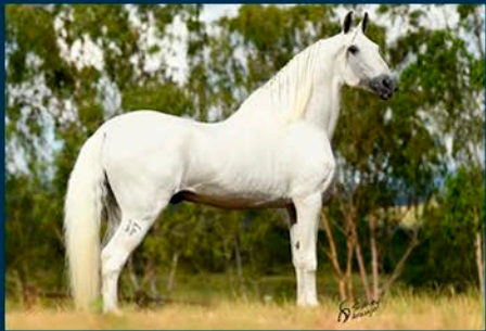
SEU AVÔ: FAVACHO DIAMANTE