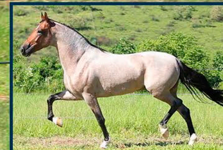
PRENHEZ POR: BARÃO CAR