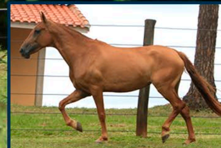
SUA MÃE: UNO LOLA