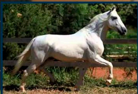
SEU PAI: HÚNGARO DA VISÃO