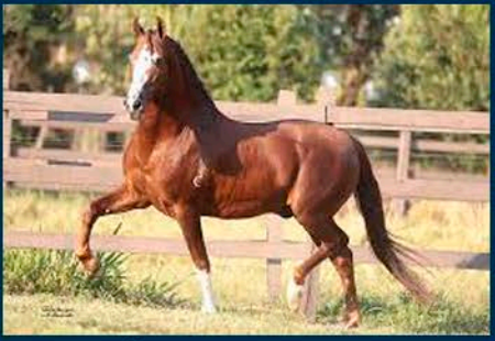
SEU AVÔ: GALANTE DO EXPOENTE