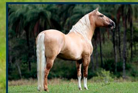
SEU PAI: FATOR DA CAVARÚ-RETÃ