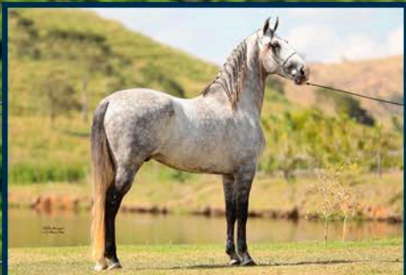
SEU PAI: OZ CÓRREGO DO OURO