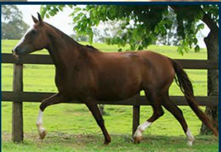
SUA MÃE: ISABELA DAS ÁGUAS JM