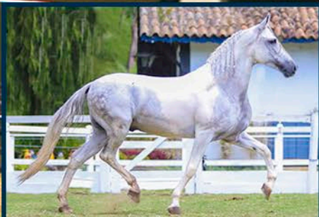
SEU PAI: GALANTE RIO RASO