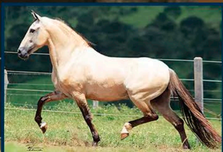
SEU AVÔ: FAVACHO ESTANHO