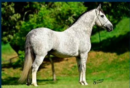
CEDRO DE MARIPÁ (PAI DA POTRA AO PÉ)