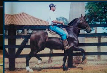
SEU PAI: QUATI DO GUEGA