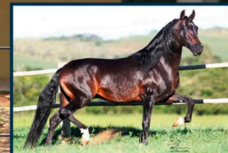
SEU PAI: ARGOS DAS MINAS GERAIS