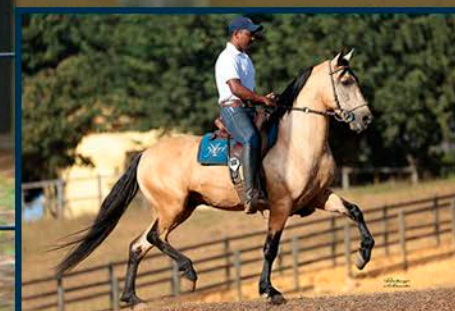
SEU PAI: GRINGO RRC