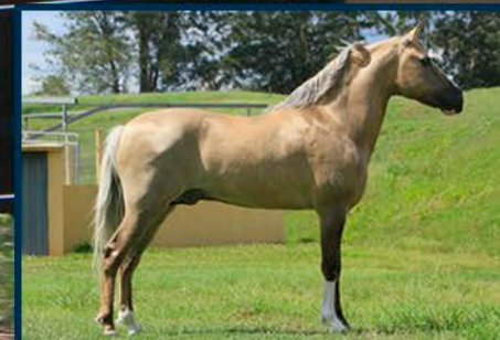
SEU PAI: ÍCARO DO PORTAL