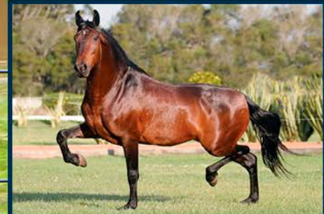
SEU AVÔ: RINGO DO CÍRCULO D