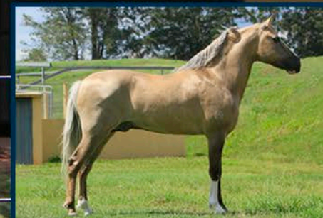
SEU PAI: ÍCARO DO PORTAL