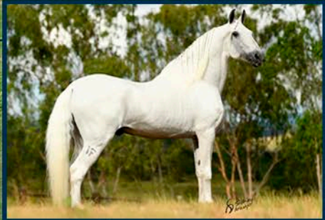
SEU AVÔ: FAVACHO DIAMANTE