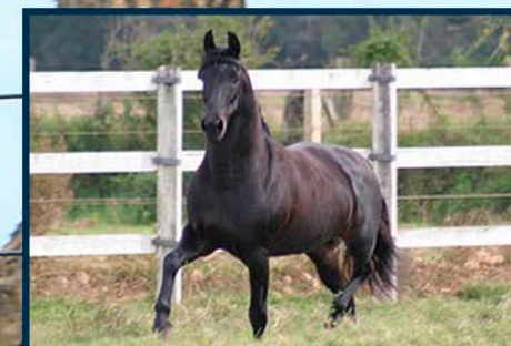
SEU AVÔ: RUBI LJ