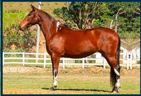
SUA MÃE: MUSA ITAOCA