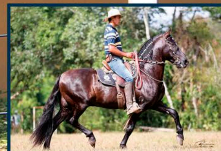
SEU PAI: CAXAMBU BEIRUTE