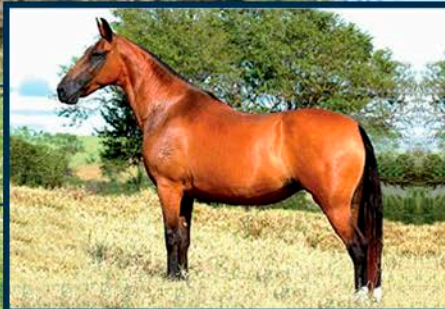
SUA AVÓ: GÔNDOLA DO CONFORTO