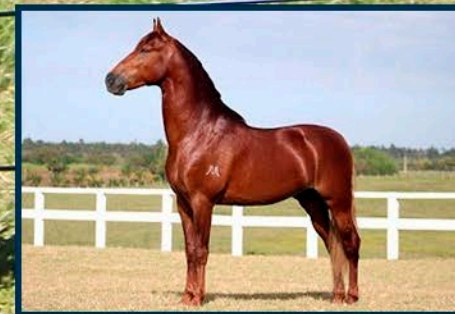
SEU AVÔ: MEAÍPE MEAÍPE