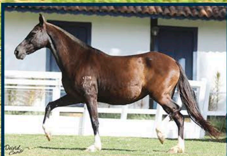
SUA MÃE: FLORESTA RANCHO POLO