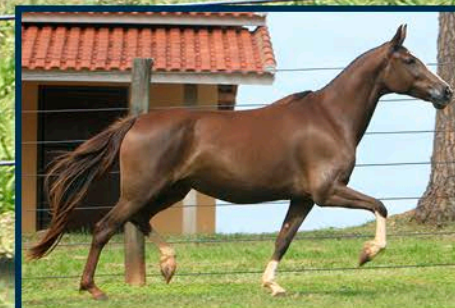
SUA MÃE: ORQUÍDEA SANTA MARINA