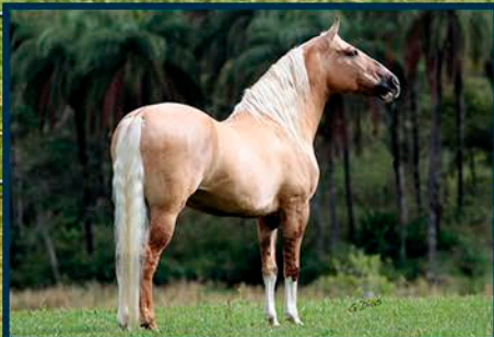
SEU AVÔ: FATOR DA CAVARÚ-RETÃ