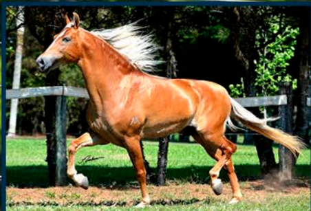
SEU PAI: TRIUNFO MEAÍPE