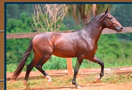
SEU PAI: VIGOR ELFAR