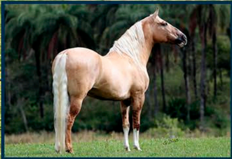
SEU AVÔ: FATOR DA CAVARÚ-RETÃ