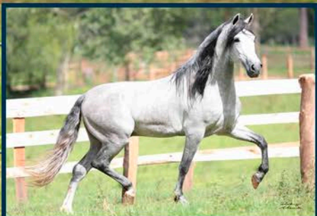
PRENHEZ POR: JUSTO DA FIGUEIRA