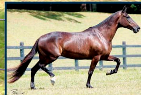
SUA AVÓ: SPARTA DO BERMA