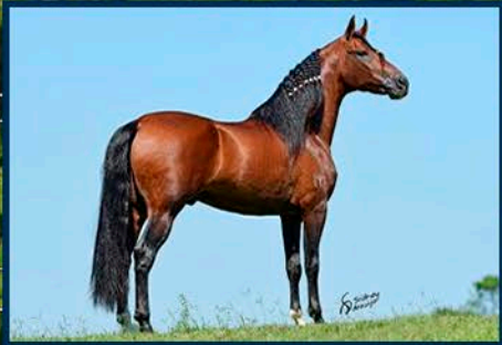
SEU PAI: POETA DO PORTO AZUL