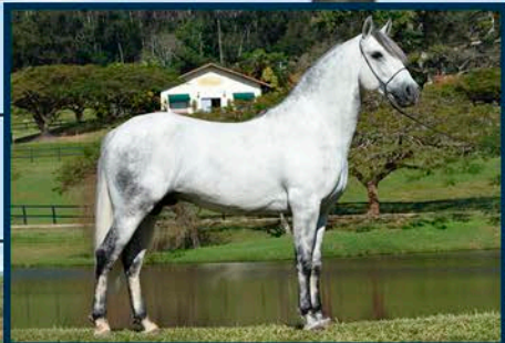
SEU PAI: FOLE DE MARIPÁ