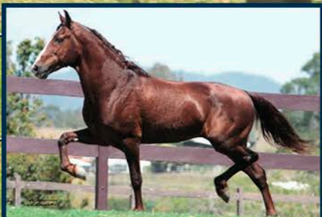
SEU AVÔ: LOBINHO LOBOS