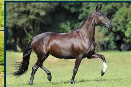
SUA MÃE: NAIA H.R.