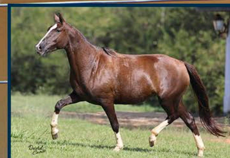
SUA MÃE: CANÁRIA TRAITUBA HR