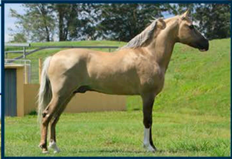
SEU PAI: ÍCARO DO PORTAL