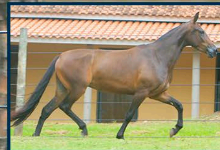
SEU PAI: DÍNAMO DO CONFORTO