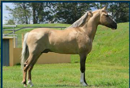
PRENHEZ POR: ÍCARO DO PORTAL