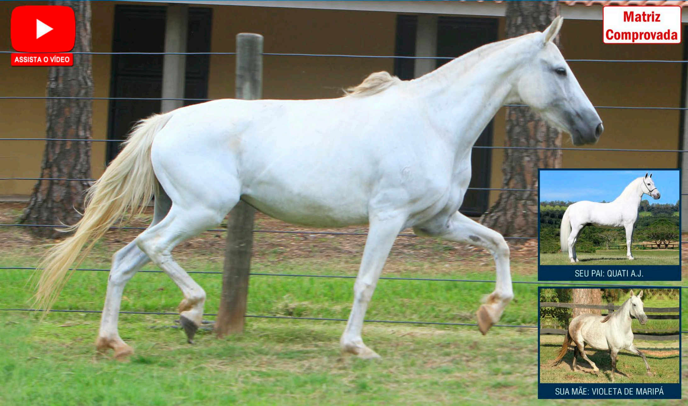
SEU PAI: QUATI A.J.