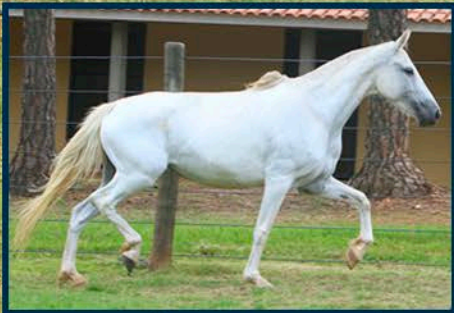
SUA MÃE: JURA DE MARIPÁ