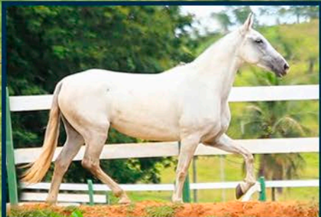
SUA MÃE: OLA CÓRREGO DO OURO