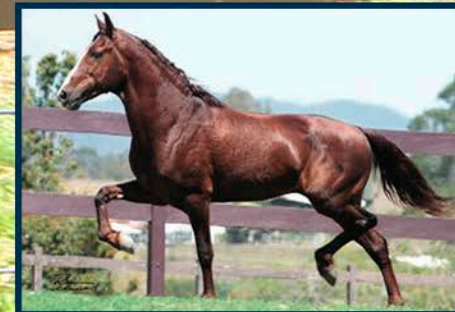
SEU AVÔ: LOBINHO LOBOS