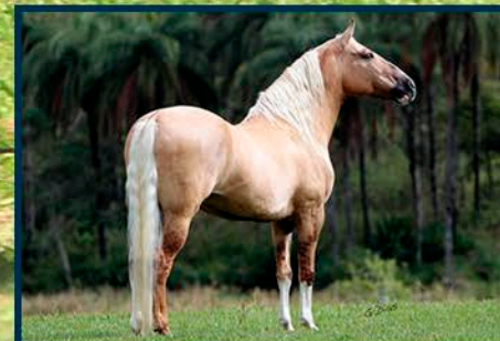
SEU AVÔ: FATOR DA CAVARÚ-RETÃ