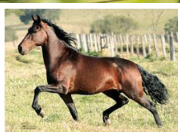
SEU PAI MEIRELLES VEZÚVIO

Égua do consagrado cruzamento Favacho x JB. Pela linha alta vai ao campeoníssimo Meirelles Vezuvio, raça de Oceano, Jáva, Original de Santa Lucia e Carvão LJ. Pela linha baixa, vai a Ubari do Pinhão Roxo, descendente direta de Favacho Malta, Favacho Quociente e Favacho Sina. Égua linda, feminina, cernelhuda e arqueada, de andamento amplo, potente e estável.