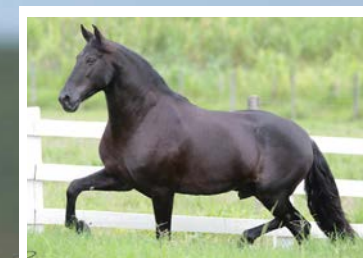
SEU PAI FEITIÇO CAXAMBUENSE

Para quem gosta de raça tai uma neta da Xangrilá Caxambuense. Pela linha alta descende de Feitiço Caxambuense, reprodutor negro, de destaque na raça, filho do campeão nacional Argos das Minas Gerais, uma TOP 3 da raça Xangrilá Caxambuense. Pela linha baixa, Garoa do Coliseu, sua mãe é raça de Etíope D2, Xale D2 e Kondor do Passo Fino. Égua de muito bom tipo, feminina, harmônica e delicada, de andamento fácil, estável e de muita amplitude. Prenhes positiva pelo reprodutor chefe da FSAP, Icaro Portal, reprodutor amarelo filho de Fator da Cavarú Retã em Vitória de Três Corações.