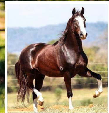
SEU PAI JAGUAR DE SÃO LOURENÇO

Lindo castrado já em doma. Pela linha alta vai ao reprodutor Jaguar de São Lourenço, cavalo fechado nas melhores origens da Mangalarga e já produtor de campeões nacionais. Pela linha baixa descende de Meiga da Mandassaia, raça do expoente Radar de Anchieta em filha de Destaque Botafogo. É o encontro do melhor do Mangalarga com a linhagem 53. Cavalo bom de tipo, caracterizado, extra de andamento, diagramado, dissociado, estável e extra de temperamento.