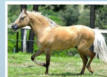
PRENHEZ POR ÍCARO DO PORTAL