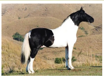
SEU AVÔ ZINCO DA INVEJADA

Olhem que belo castrado pampa de castanho. Pela linha alta descende de Olha do Vale da Prata, Zinco da Invejada, Multidão da Ogar e Globo da Ogar. Pela linha baixa vai a Lycury Novela, raça de Herdade Prateado, Herdade Cadillac e Uirapuru Bela Cruz. Lindo, forte, estruturado, de andamento natural de marcha picada de muita estabilidade.