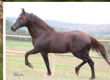
SEU PAI TRILHO DA ZIZICA

PARA TUDO LEILÃO!!! Esse é reprodutor, lindo, marchador e filho do Trilho da Zizica. Pela linha alta, vai no campeoníssimo Trilho da Zizica, é irmão portanto de Galante, Turbante, Xispa, Athos, Dínamo, dentre tantos outros animais de destaque na raça. Pela linha baixa, vai no Imperador JB, Fantoche do Nilo, Rioja da Boa Fé, Espanhol Kafé da Nova e Guitarra do Yuri. Cavallo de boas proporções, muita caracterização racial, que nos impressiona pelo seu andamento. É marchador, é dissociado, tem diagrama, tem habilidade, tem temperamento de sela e tem comodidade. E ainda é pampa e é filho do Trilho da Zizica. Cavallo para fazer tropa.