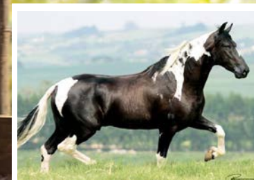
RAÇA DE FANTOCHE DO NILO

Pensa numa égua marchadeira. Pela linha alta vai no Abraço KM, reprodutor pampa, raça de Fantoche do Nilo e Jaqueta do Nilo. Pela linha baixa, vai a PGP Cuba, raça de Herdade Fidalgo, Hippiie da Esperança e Expresso de Santa Lucia. Linda, expressiva e de muito boas angulações, andamento marchado com muita dissociação, posteriores fortes e muita estabilidade corpórea. Prenhes positiva por Duque KM, reprodutor pampa de preto filho de Rayban da Santa Esmeralda com Quina da Santa Esmeralda.