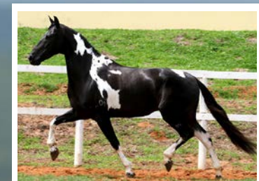
SEU PAI ESCOTEIRO DE REGADAS

Ta procurando uma potra natural de marcha picada? Pela linha alta vai ao campeão nacional de marcha Escoteiro de Regadas, raça de Talismã Kafé, Festival da Ogar e Rumba LJ. Pela linha baixa, vai a Dança da Seara Dourada, Troiano JB da Ogar, Guizo da Meia Lua e Caxambu Ion. Potra muito boa de morfologia, frente bem direcionada, muito estruturada, linda, de andamento natural, estável e de muita qualidade de movimento.