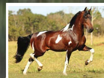
SEU PAI CARNAVAL DE SÃO LOURENÇO

Olhem que lindo reprodutor! Pela linha alta vai no Carnaval de São Lourenço, raça de Fantoche do Nilo e Fama Savana, por Omelete JB e Vitrine JB. Pela linha baixa, vai na doadora pampa de preto Eleita KM. Cavallo extra de tipo, frente alta, grande, nobre, de andamento marchado, dissociado e de muito boa movimentação e temperamento.