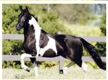
SEU AVÔ RAYBAN DA SANTA EASMERALDA

Potra TOP do Leilão. Pela linha alta vai ao pampa de preto Duque KM, raça de Rayban da Santa Esmeralda na Quina da Santa Esmeralda, raça de Ringo D2 na Negra da Santa Esmeralda. Pela linha baixa, vai na Filipina do Porto Azul, raça de Gaiteiro, Herdade Capricho, Dolar Edu e Turista de Passa Tempo. Potra de muito bom tipo e caracterização, boa ossatura e angulações, de andamento marchado, amplo e dissociado.