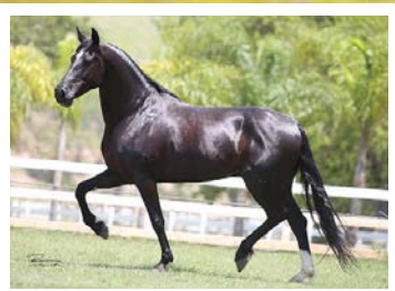
SEU PAI PATRIARCA DA SANTA ESMERALDA

Mais uma égua para fazer tropa amigos. Raçuda, linda e marchadeira. Pela linha lata, vai ao extraordinário Patriarca da Santa Esmeralda, filho de Ringo D2 na Madrinha da Vandja. Pela linha baixa, vai na doadora pampa de preto Eleita KM. Tipo extra, frente alta, espádua oblíqua, arqueada e garupuda. Andamento marchado, dissociado, discreto e amplo.