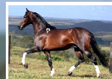
SEU PAI ESPAÑHOL KAFÉ DA NOVA