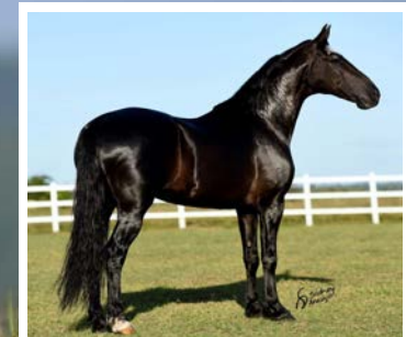
SEU PAI ELFO DO PORTO AZUL

Ta procurando um reprodutor negro de marcha picada, e ainda por cima filho do melhor cavalo da raça? Pela linha alta descende do melhor cavalo da Raça, Elfo do Porto Azul. Raça de Haity Caxambuense, Samira do Porto Azul, Original de Santa Lucia, Quartel JB e Herdade Capricho. Pela linha baixa, descende da doadora negra Fabula Alto da Serra, raça do lindo Portinari da Santa Esmeralda, Elo Kafé da Nova, Chamoso da Portela e Japecanga da Calciolândia. Cavalo de bom tipo, frente leve, bem direcionada, cernelhudo, de andamento fácil, muito cômodo e excelente gesto de marcha.