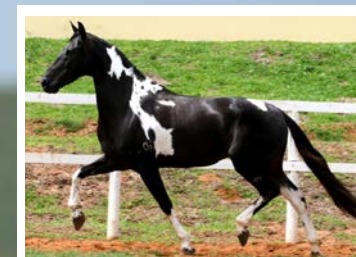
SEU PAI ESCOTEIRO DE REGADAS