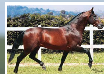
SEU AVÔ BEIJO JB

Raridade!!! Égua com a grife JB estampada no braço. Pela linha alta, descende de Raro JB, Beijo JB, Linche JB, Atrevido JB e Omelete JB. Pela linha baixa, descende de Máscara, Sioux, Xingu JB, Lança JB, Escudo JB e Copacabana JB. Égua linda, estruturada, muito caracterizada, de andamento marchado, dissociado e de excepcional diagrama de marcha. Prenhes positiva pelo reprodutor chefe da FSAP, Icaro Portal, reprodutor amarelo filho de Fator da Cavarú Retã em Vitória de Três Corações.