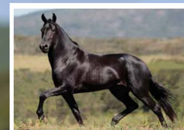
SEU AVÔ ETIOPE D2

Égua linda, fruto do melhor cruzamento Lobos x JB. Pela linha alta vai ao extraordinário Lancelot Sarimar, raça de Etíope D2, Xale De e JN Degas 53. Pela linha baixa, vai a Luz Corrego de Ouro, raça de Kalifa da Cachoeira na Xepa Kafé. Lobos x JB pura. Égua de rara beleza, espádua obliqua, tronco forte e ótimos aprumos. Andamento rolado, discreto e de grande estabilidade corpórea. Prenhes positiva pelo reprodutor chefe da FSAP, Icaro Portal, reprodutor amarelo filho de Fator da Cavarú Retã em Vitória de Três Corações.