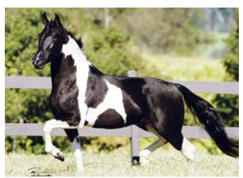
SEU AVÔ RAYBAM DA SANTA EASMERALDA

Tai um lindo potro pampa. Pela linha alta vai ao pampa de preto Duque KM, raça de Rayban da Santa Esmeralda na Quina da Santa Esmeralda, raça de Ringo D2 na Negra da Santa Esmeralda. Pela linha baixa, sua mãe é a extraordinária Escalada KM, raça de Fantoche do Nilo e Favacho Malta. Potro de bom tipo, espadua oblíqua e profundo, andamento natural de marcha de centro, pernas fortes e muito ativo.