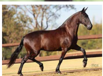
SUA AVÓ QUINA DA SANTA ESMERALDA

Potro castanho que nos encanta pela qualidade do movimento. Pela linha alta vai ao pampa de preto Duque KM, raça de Rayban da Santa Esmeralda na Quina da Santa Esmeralda, raça de Ringo D2 na Negra da Santa Esmeralda. Pela linha baixa, vai a mais importante matrilinea da tropa KM. Rioja da Boa Fé, raça do tetra Campeão nacional Espanhol Kafé da Nova na campeã nacional Guitarra do Yuri. Potro forte, arqueado, estruturado, de andamento natural, marcha de centro, mãos roladas, pernas fortes e habilidade na troca de apoios.