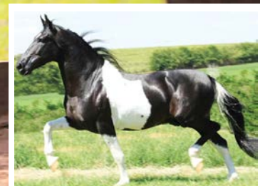
SEU AVÔ ROMEIRO DA TODAY

Linda égua negra. Pela linha alta, vai ao Camafeu KM. Reprodutor pampa filho de Romeiro da Today na campeã nacional Inconfidência JSR, égua livro de elite com mais de 80 premiações em pista. Pela linha baixa descende da lindíssima Batucada KM, raça de Olhar do Vale da Prata na Eleita KM. Égua muito boa de tipo, caracterizada, frente alta e arqueada, de andamento potente, muito articulado e avante.