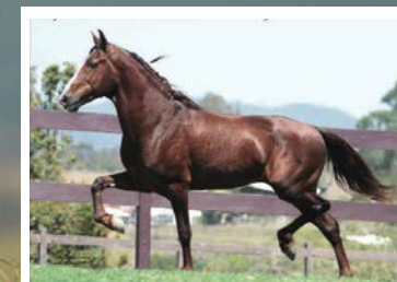
SEU AVÔ LOBINHO LOBOS

Além de linda reúne o melhor das linhagens sul mineiras. Pela linha alta vai ao fenômeno Salmon NRM, filho de Abismo do Triangulo Jota, raça de Chimango, Esperança Lobos e Angai Cartão. Pela linha baixa, descende de Traituba Espada, raça de Lobinho Lobos na Folia da Terra Quebrada. Égua muito caracterizada no Sul de Minas. Frente alta, forte ossatura e qualidade de membros, andamento amplo, estável e de muita qualidade de movimento.