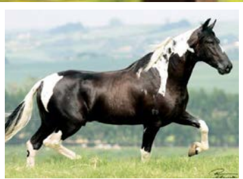
RAÇA DE FANTOCHE DO NILO

Reparem no que marcha essa pampa. Pela linha alta descende do reprodutor pampa Abraço KM, raça de Fantoche, Ébano NRM e Angai Cartão e Esperança Lobos. Pela linha baixa, descende de Ubari do Pinhão Roxo, Favacho Malta, Favacho Quociente e Favacho Sina. Linda égua pampa, de frente alta, cernelhuda, arqueada, de bons aprumos, andamento marchado, avante, e de muita potência e estabilidade corpórea.