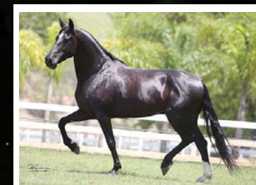
SEU PAI PATRIARCA DA SANTA ESMERALDA

Olhem que castrado Top! Pela linha alta vai ao campeoníssimo reprodutor negro Patriarca da Santa Esmeralda, raça de Ringo D2 na Madrinha da Vandja. Pela linha baixa, vai a Cubana KM, raça de Abraço KM, Fantoche do Nilo e Híppie da Esperança. Cavalo negro, lindo, muito marchado, dissociado, extra de temperamento e rara habilidade.