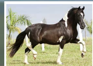
SEU PAI SINCERO DO PORTO AZUL

Olhem que caixote de égua fechada nas melhores origens da JB. Pela linha alta, vai ao extraordinário pampa de preto Sincero do Porto Azul, raça de Haity Caxambuense, Pampaneira do Porto Azul e Atrevido JB. Pela linha baixa, vai a Dama de Nanuque, filha ao reprodutor Inglês JB, neta do campeão nacional Balote AC. Raça de Beijo JB e Herdade Capricho. Égua muito estruturada, arqueada, de ótimas proporções e andamento avante, com posteriores fortes e mãos roladas. Prenhes positiva pelo reprodutor da FSAP, Barão CAR, reprodutor rosilho filho de Futuro Capim Fino em Natasha Santa Rosa.