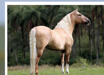
SEU PAI FATOR DA CAVARU RETÃ

PARA TUDO LEILÃO!!! Momento único do leilão. Filho direto do Fator, lindo, marchador, aprumado e bom de sela. Pela linha alta vai ao cavalo do momento, Fator da Cavarú Retã. Raça de Favacho Estanho na Qualidade da Zizica. Irmão, portanto, do Ulisses, da Birmânia da Capadócia dentre tantos outros campeões nacionais. Pela linha baixa vai a campeoníssima Ubatubinha da Santa Esmeralda, filha de Nero, raça de Ringo D2, Xica da Esperança e Elo Kafe da Nova. Cavalo refinado, lindo, muito bom de tipo, de andamento muito diagramado, cômodo e de extraordinária qualidade de movimentação.