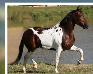
SEU PAI CAIZER LJ

PARA TUDO LEILÃO!!! Pela linha alta vai a um dos mais belos cavalos da raça. Caizer LJ, raça de Tribunal LJ, Xícara LJ, Pagé LJ e Quartel JB. Pela linha baixa, vai a Dama da Rosa Mística, raça de Hindí da Mandassaia, Melodia da Today, Guru de Cavabru e Miragem de Mairiflor. Essa é linda até mandar parar. Boa de tipo e com uma pelagem exuberante. Feminina, expressiva, marchada, de mãos roladas e posteriores fortes. Pai e mãe pampas, não foi feito exame de homozigose, mas tem grandes possibilidades de ser homozigota.