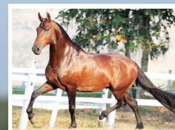
SEU AVÔ TIGRÃO KAFÉ

Égua preta, linda, fechada no melhor da linhagem JB. Reparem na energia dessa égua. Pela linha alta, vai a Normando JB da Ogar, raça de Galeão da Ogar, Paraguaia da Ogar e Apolo JB. Pela linha baixa, vai a AR Gatona, raça do Grande Campeão Nacional da Raça Tigrão Kafé na AR Champagne. Égua linda, grande, profunda, extra de direção de frente, de boas angulações, andamento enérgico, potente e de muito temperamento de sela.