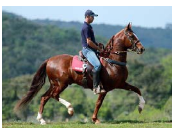
SEU PAI CACADOR DA SELVA MORENA

Olhem que égua raçuda. Pela linha alta vai ao Caçador da Selva Morena, reprodutor fechado no melhor da linhagem dos Lobos, raça de Ministro e Vanuza. Pela linha baixa, vai a Turbina da Selva Morena, raça de Acaiá, Beijo e Quitandinha JB. Frente leve, cernelhuda, estruturada e expressiva, de andamento marchado, discreto na movimentação e com boa amplitude de passadas.