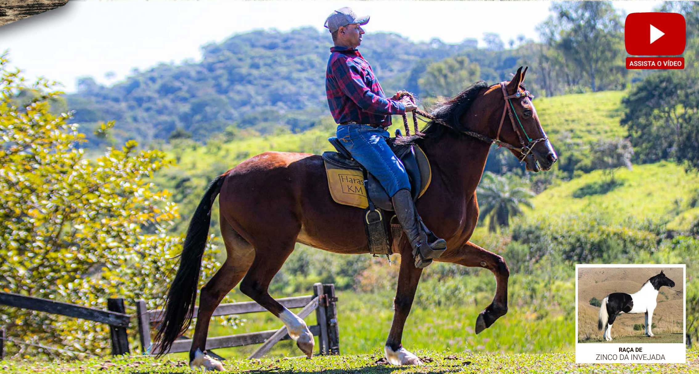
RAÇA DE ZINCO DA INVEJADA

Esse é pra quem ta procurando um cavalo de sela lindo e extra de montada. Pela linha alta vai ao Bárbaro KM, raça de Olhar do Vale da Prata, Zinco da Invejada, Fogo JB, Original de Santa Lucia e Globo da Ogar. Pela linha baixa, descende de Lycury Novela, Herdade Prateado, Herdade Cadillac e Irapuru Bela Cruz. Cavalo que nos encanta por seu belo tipo, frente bem direcionada e estrutura corpórea, de andamento marchado, avante, cômodo e muito bom de temperamento.