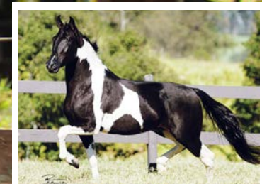
SEU AVÔ RAYBAN DA SANTA EASMERALDA

Castrado para ser o cavalo da patroa. Pela linha alta, vai ao Camafeu KM. Reprodutor pampa filho de Romeiro da Today na campeã nacional Inconfidência JSR, égua livro de elite com mais de 80 premiações em pista. Pela linha baixa, vai a mais importante matrilínea da tropa KM. Rioja da Boa Fé, raça do tetra Campeão nacional Espanhol Kafé da Nova na campeã nacional Guitarra do Yuri. Lindo, forte, completo em sua morfologia, andamento marchado, dissociado, amplo e estável. E ainda tem olho azul. Cavalo para ser destaque em qualquer tropa de sela.