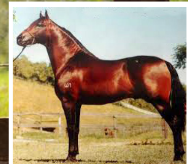
RAÇA DE HERDADE CAPRICO

Mais uma bela pampa de ótima carga genética. Pela linha alta descende do reprodutor pampa Mistério dois Irmãos. Pela linha baixa, descende Ilusão do Conforto, filha de Ferro do Conforto na Espoleta do Conforto, raça de Herdade Capricho e Argentina JB. Égua de bom tipo, caracterizada e de boa ossatura, andamento avante articulado e potente.