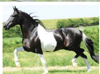
SEU AVÔ ROMEIRO DA TODAY

Castrado de marcha centro pra picada. Pela linha alta, vai ao Camafeu KM. Reprodutor pampa filho de Romeiro da Today na campeã nacional Inconfidência JSR, égua livro de elite com mais de 80 premiações em pista. Pela linha baixa, descende de Ubari do Pinhão Roxo, Favacho Malta, Favacho Quociente e Favacho Sina. Cavalo forte, estruturado, de marcha de centro para picada.