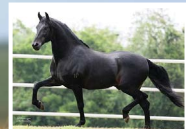
SEU PAI ORIGINAL DO PASSO FINO

Taí uma éguaça para os amigos da marcha picada. Pela linha alta vai ao grande Campeão Nacional Original do Passo Fino. Raça de Seiko LJ< Maragato LJ, Carvão LJ, Destaque Honra e Trocadero 53. Pela linha baixa vai a Harmonia FC, raça de Tarumã Kafé, Rabisco LJ e Original de Santa Lucia. Égua grande, forte, refinada e linda. Andamento marchado, coordenado, discreto e natural. Prenhes positiva pelo reprodutor chefe da FSAP, Icaro Portal, reprodutor amarelo filho de Fator da Cavarú Retã em Vitória de Três Corações.