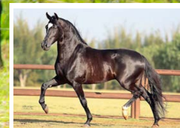
SEU PAI FUZILEIRO DA SANTA ESMERALDA

Reprodutor negro com genética de garanhão. Pela linha alta descende do Campeão Nacional Fuzileiro da Santa Esmeralda, raçador negro filho de Alegre da Today e Conquistador Tzarina. Pela linha baixa descende da lindíssima Batucada KM, raça de Olhar do Vale da Prata na Eleita KM. Cavallo de bom tipo, grande, estruturado, de boa ossatura, e de andamento avante, articulado, amplo e muito diagramado.