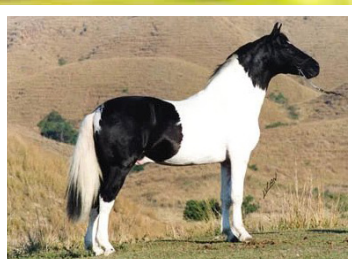
SEU AVÔ ZINCO DA INVEJADA

Égua linda para fazer Tropa. Pela linha alta descende de Olha do Vale da Prata, Zinco da Invejada, Multidão da Ogar e Globo da Ogar. Pela linha baixa descende da pampa de preto Eleita KM. Égua de bom tipo, cernelhuda, arqueada, de andamento natural, posteriores que trabalham dentro da massa e muita estabilidade corpórea.