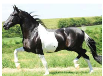
SEU AVÔ ROMEIRO DA TODAY

Castrado muito bom de marcha. Pela linha alta, vai ao Camafeu KM. Reprodutor pampa filho de Romeiro da Today na campeã nacional Inconfidência JSR, égua livro de elite com mais de 80 premiações em pista. Pela linha baixa, sua mãe Jornada das Crizaldas vai a Corsario do rancho Alto e Sama Ion. Cavallo lindo, extra de tipo, forte, marchador, estável e de atitude nobre.