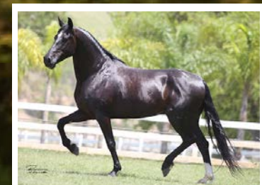
SEU PAI PATRIARCA DA SANTA ESMERALDA

Pensa num castrado lindo, e extra de sela. Verdadeiro cavalo de patrão. Pela linha lata, vai ao extraordinário Patriarca da Santa Esmeralda, filho de Ringo D2 na Madrinha da Vandja. Pela linha baixa, vai na doadora pampa de preto Eleita KM. Cavalo lindo, de grande porte, frente alta, muito marchado, estável e de notável temperamento de sela.