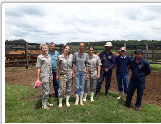
Estagiárias da França

É com orgulho que a Fazenda SAP em parceria com as Universidades em São Paulo é escolhida para receber estudantes estrangeiros para Estágio. Neste mês recebemos estagiárias da França.